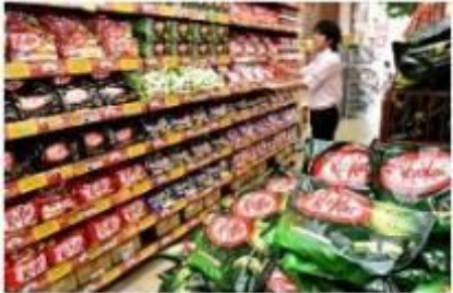
▲外国人観光客に人気のキットカットが山積み