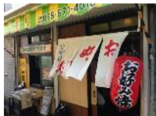
▲1945年創業の老舗も参加