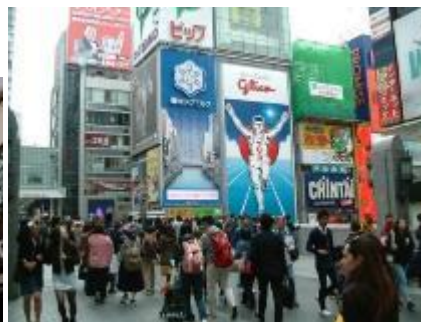
▲戒橋の賑わい、グリコネオン