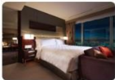
大阪マリオット都ホテル スイートルーム一例