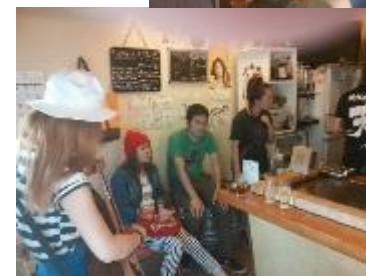
▲バルイベントで盛り上がる店内

参加者は3枚つづりのバルチケットを購入し、各店でチケット1枚につき料理1品とワンドリンクに交換する仕組み。前売り・当日＝2,500円。バルチケットは参加各店のほか、開催当日に地下鉄海岸線主要駅（三宮・花時計前駅、ハーバーランド駅、新長田駅）の改札口付近に特設ブースを設置して販売した。