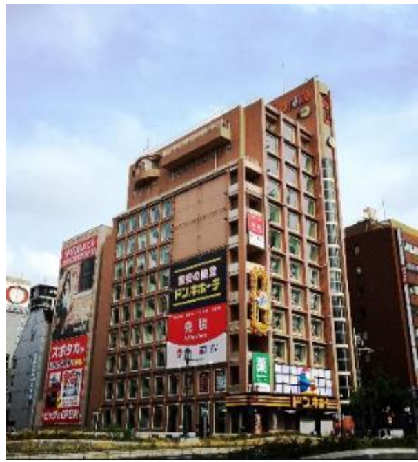
▲御堂筋通に面したインパクトのある概観

新店舗からわずか約250メートル東には中国人に人気の赤サンゴネックレスなど宝飾品も取り扱う「道頓堀店」があるが、2店舗体制で外国人客の一層の取り込みを狙う。