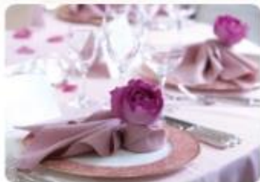
天王寺都ホテルイメージ

オプションとして、近畿日本ツーリストハルカス海外旅行サロンでハネムーン、あべのハルカス近鉄本店(百貨店)で結婚指輪、引き出物なども提案できるという。