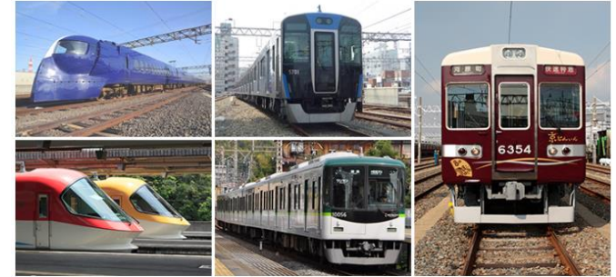
【イメージ図】上段左:南海 特急ラピート 上段中:阪神 5700系車両 右:阪急 京とれいん 下段左:近鉄 伊勢志摩ライナー 下段中:京阪 10000系車両