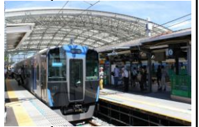
阪神甲子園駅ホーム

2015年3月19日から4月1日まで - イディナ・メンゼル(原曲歌唱)「Let It Go~ありのまままで~」第87回選抜高等学校野球大会開催