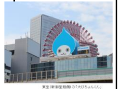
梅田(新製室ビル)の「大ぴちゅんくん」

また、春の花粉やPM2.5、夏の熱中症についても注意を喚起するという。例えば暑い日にはぴちゅんくんが汗をかき、花粉が多い日にはマスクをする。PM2.5が多く観測されると涙を流す。ほかにも、目をキョロキョロと動かし、英語でコメントしたり、ウィンクをして写真撮影を促したりと、大阪の新たなシンボルになることを目指す。