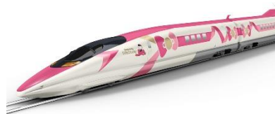
▲地域を「つなぐ」「結ぶ」という思いが詰まったリボンを纏った車体イメージ

また、阪急電鉄初となる車内無料Wi-fiサービスを京都線車両9300系と「京とれいん」に導入、更には自動外貨両替機の設置、駅のトイレの洋式化を推進するなど国外からの訪日観光客に向けた新たな阪急電鉄が見れそうだ。