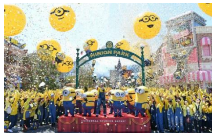
▲ミニオンエリアの新アトラクションも楽しみだ

また2018年6月30日からは、2017年に約100億円の投資を経て完成した「ミニオン・パーク」エリアに新たなアトラクションとなる「ミニオン・ハチャメチャ・アイス」が開業予定。更に2020年の夏には任天堂の世界的人気キャラクターマリオが登場する「SUPER NINTENDO WORLD」エリアも開業予定とUSJから目が離せない。