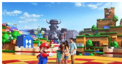
▲「SUPER NINTENDO WORLD」の完成イメージ画像。