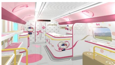
▲「キティ新幹線」の車両内イメージ