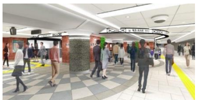
▲烏丸駅西改札口のリニューアルイメージ