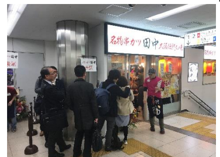
▲串カツ田中オープンの様子

駅では現在、駅ナカ商業施設と駅施設のリニューアル工事を進めており、2018年8月から2019年7月にかけて順次オープンしている。店舗部分の面積を 220平方メートル増床し533平方メートル とし、リニューアル前は18店舗だった飲食店・物販店が24店舗となる。2月15日(金)には、混みがちな東トイレとすいている西トイレを中央の1カ所に集約したことで、トイレの総面積を変えずに混雑の緩和を果たした。