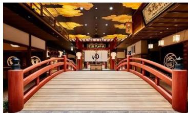
▲安土桃山時代にタイムスリップ!?

約1000坪もの広大な屋上日本庭園となっています。散歩できるようになっていて、足湯や千本鳥居、四季折々の花々を眺めながらくつろげます。