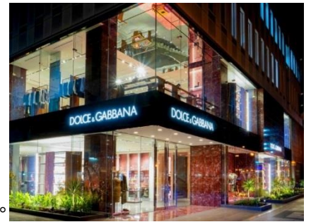
▲リニューアルオープンした「ドルチェ&ガッバーナ 御堂筋」

今回は、ウイメンズ、メンズのレディウウェア、アクセサリコレクションを幅広く取り扱うほか、新しく チルドレンコレクション がラインナップに加わる。チルドレンコレクションのための独立したエリアも新設。この空間は、日本からインスピレーションを得た繊細な花模様が壁を彩り、まさに「 ドルチェ&ガッバーナ 」の美学と日本の文化が融合したつくりだ。