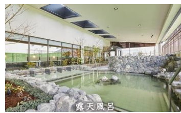
▲広々な露天風呂も有り!!!