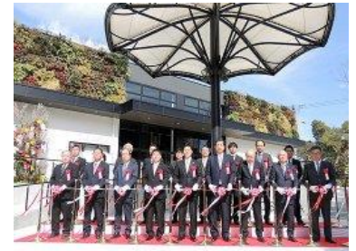
▲オープニングセレモニーの様子

また同日には、COOL JAPAN PARK OSAKA全体のこけら落とし公演「『 さんま・岡村の花の駐在さん 』~駐在さんが復活って、そんなアホなことあるか、それはないやろ…ホンマや!!~」が、TTホールにて1日限定で行われた。